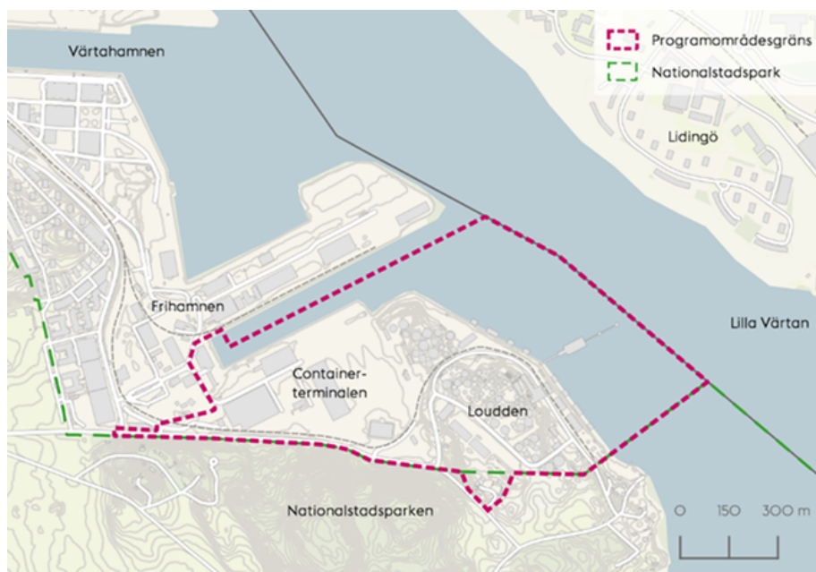
Figur 1. Planprogramområde för Loudden.

Den nya stadsdelen Loudden ska huvudsakligen byggas på mark som fram till 2020-12-31 nyttjats för hamnverksamhet. Utvecklingen möjliggörs av att Hamnen i det nya Hamnavtalet återlämnar hela arrendeområdet Loudden samt del av arrendeområde Frihamnen (f.d. containerterminalen m.m) till exploateringskontoret. Genomförandeavtal tecknas mellan Hamnen och exploateringskontoret för hantering av frågor rörande marksanering, inlösen av byggnader, övertagande av anläggningar såsom bergrum, kajer och tekniska installationer. Även reglering av redan tagna kostnader avseende återställning av mark omfattas.